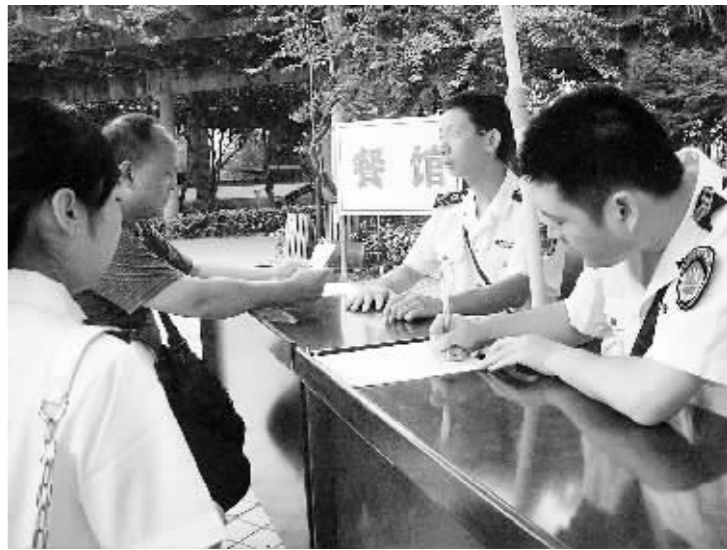
为进一步提高卫生执法监督人员对食物中毒事件应急处理的组织、指挥、协调、防控、调查和救治能力。7月12日,翠屏区卫生执法监督大队在菜坝镇开展了食物中毒事件应急处置演练。图为演练现场中,卫生执法监督人员对“食物中毒事件”进行笔录。 江小华 本报记者黄清华摄